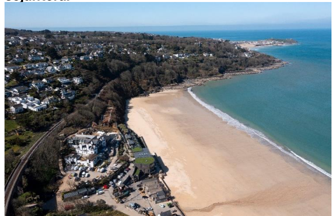
Foto 2 – Aerial view of Carbis Bay, St Ives, Cornwall, UK (tempat pertemuan G7 tahun 2021)

Pada pertemuan G7 tahun 2021, para pemimpin memiliki 1 tujuan untuk membantu dunia melawan dan membangun kembali dari virus corona dan membuat masa depan yang lebih hijau dan sejahtera.